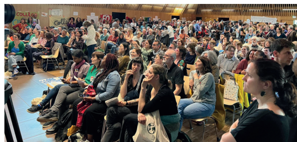
Grande soirée pour l'École, jeudi 11-04-24