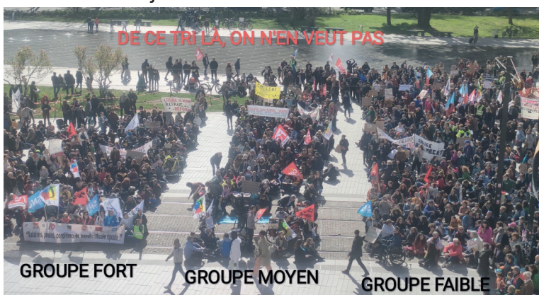
Groupe de niveaux, manifestation du 23-03-24